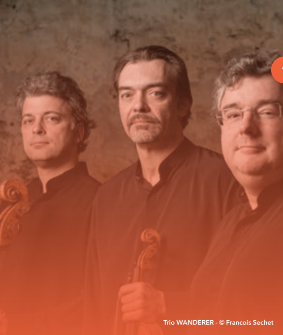
Trio WANDERER