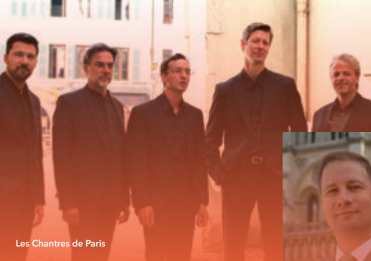
Les Chantres de Paris