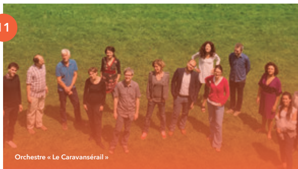
Orchestre « Le Caravansérail »