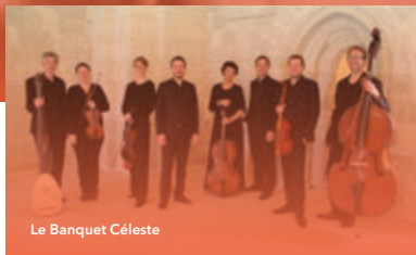
Le Banquet Céleste