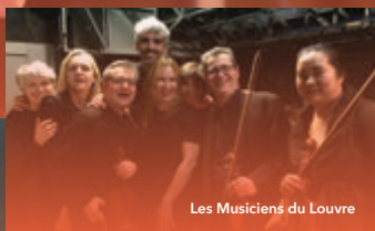
Les Musiciens du Louvre