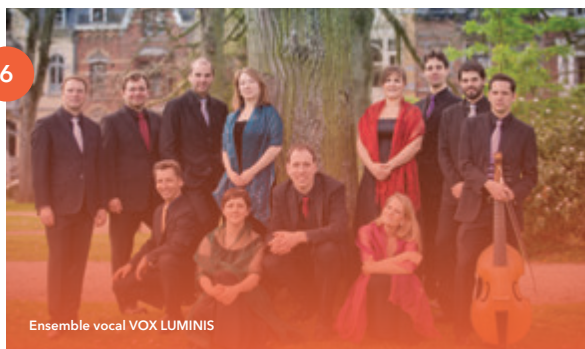
Ensemble vocal VOX LUMINIS