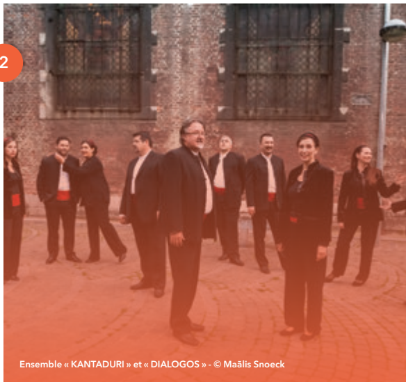
Ensemble « KANTADURI » et « DIALOGOS »